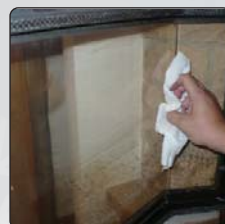
Foto 3: jednoduše setřete a vyleštíte kuchyňskou papírovou utěrkou