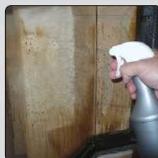
Foto 2: naneste pomocí rozprašovače na místa, která potřebujete očistit a nechte působit cca. 3 min.