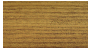
ARANY TÖLGY / STEJAR AURIUM