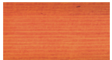
CSERESZNYE / CIREŞ