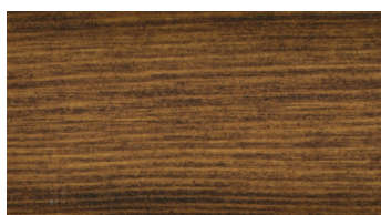
PALISZANDER / PALISANDRU