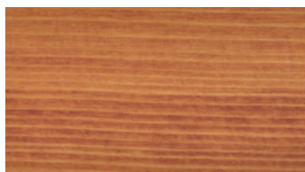
MAHAGÓNI / MAHON