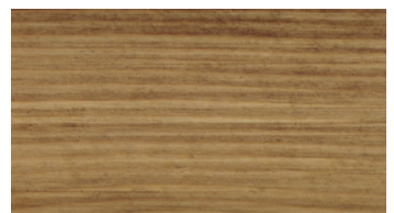
TIKFA / TEC